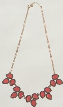
Collier plastron AU PRINTEMPS PARIS, 70% résine, 30% métal, 30 €, Exclusivité Printemps. TOUS MAGASINS

Des centaines d'idées et beaucoup d'exclusivités pour trouver l'inédit car Noël aime les surprises, des plus simples aux plus sophistiquées.