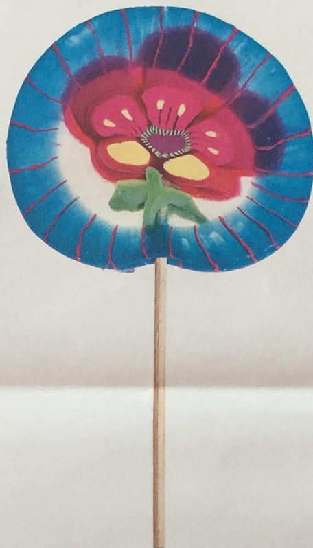
Maxi-sucette TASTY, 5 €.

ITALIE, NATION, PARLY, VELIZY, DEAUVILLE, LILLE, LYON, MARSEILLE LA VALENTINE, MARSEILLE TERRASSES DU PORT, TOULON