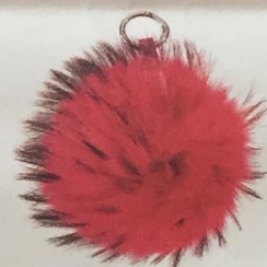
Porte-clés AU PRINTEMPS PARIS, 100% fourrure naturelle, 39 €, Exclusivité Printemps. TOUS MAGASINS

TOUS MAGASINS SAUF LOUVRE, CAGNES-SUR-MER, DEAUVILLE, LE HAVRE, MARSEILLE TERRASSES DU PORT.