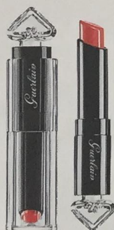
Rouge à lèvres « La Petite Robe Noire » GUERLAIN, teinte « Blush Bustier », 29,50 €, Exclusivité Printemps. TOUS MAGASINS SAUF ITALIE, LOUVRE, NATION.