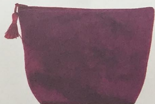
Trousse AU PRINTEMPS PARIS, velours, 22 €, Exclusivité Printemps.

TOUS MAGASINS SAUF LOUVRE, CAGNES-SUR-MER, DEAUVILLE, LE HAVRE, MARSEILLE TERRASSES DU PORT.