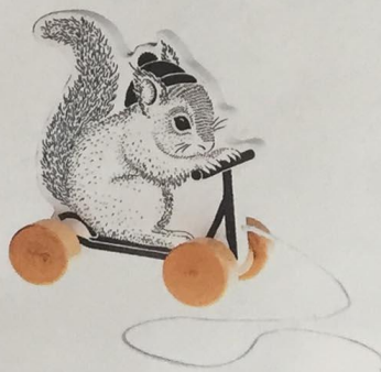
Écureuil à tirer BLOOMINGVILLE MINI, bois, 19 €, Exclusivité Printemps. HAUSSMANN, NATION, VÉLIZY, LILLE, MARSEILLE LA VALENTINE.